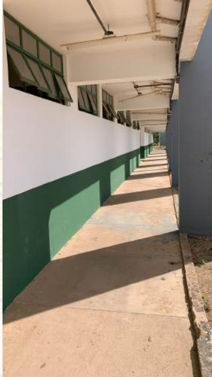
Arquivo 06 - AUSENCIA DE ILUMINAÇÃO.jpeg