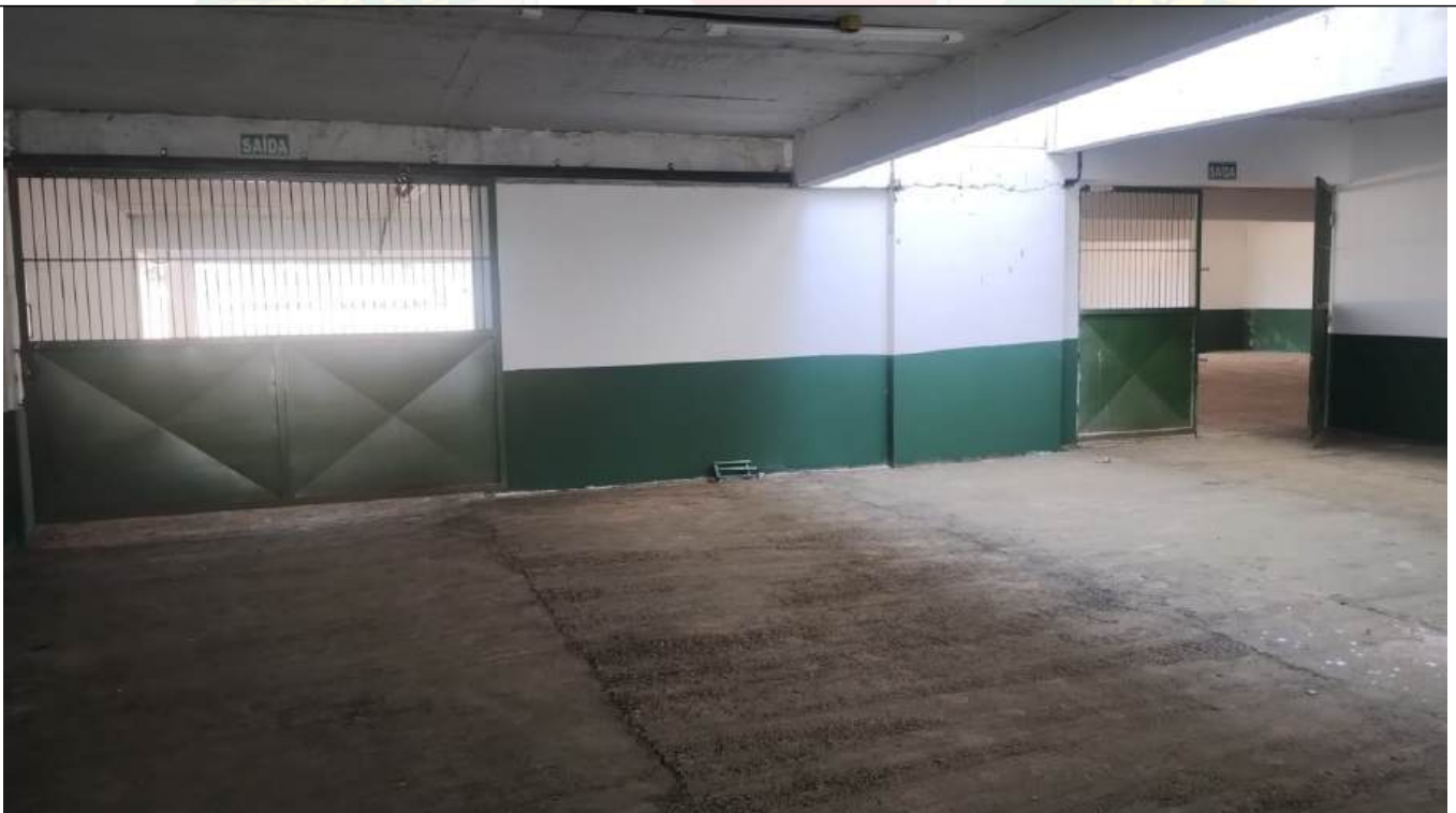
Arquivo 05 - ABERTURAS IRREGULARES PORTÃO DE CORRER E SEM BARRA ANTIPANICO.jpeg