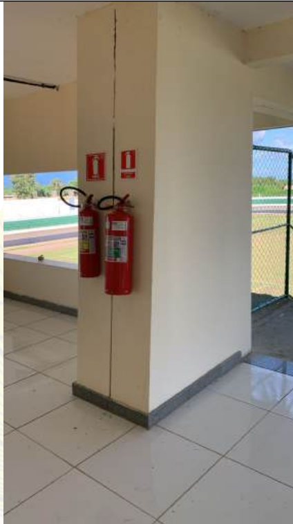
Arquivo 22 - SINALIZAÇÃO INCORRETA DE EQUIPAMENTOS.jpeg