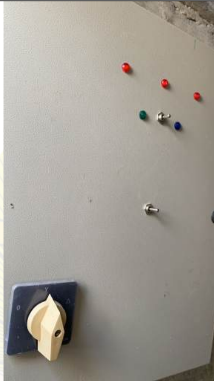
Arquivo 09 - PAINEL FORA DO PARDÃO..jpeg Registro de Atribuição