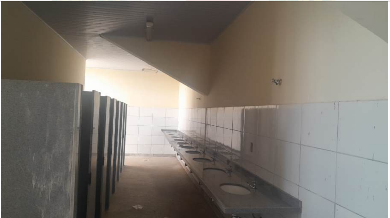
Arquivo 10 - BANHEIROS SEM SINALIZAÇÃO E ILUMINAÇÃO DE EMERGENCIA.jpeg Registro de Atribuição