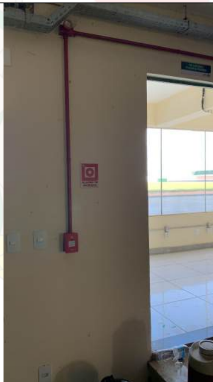
Arquivo 21 - SISTEMA DE ALARME INCOMPLETO E DESLIGADO..jpeg