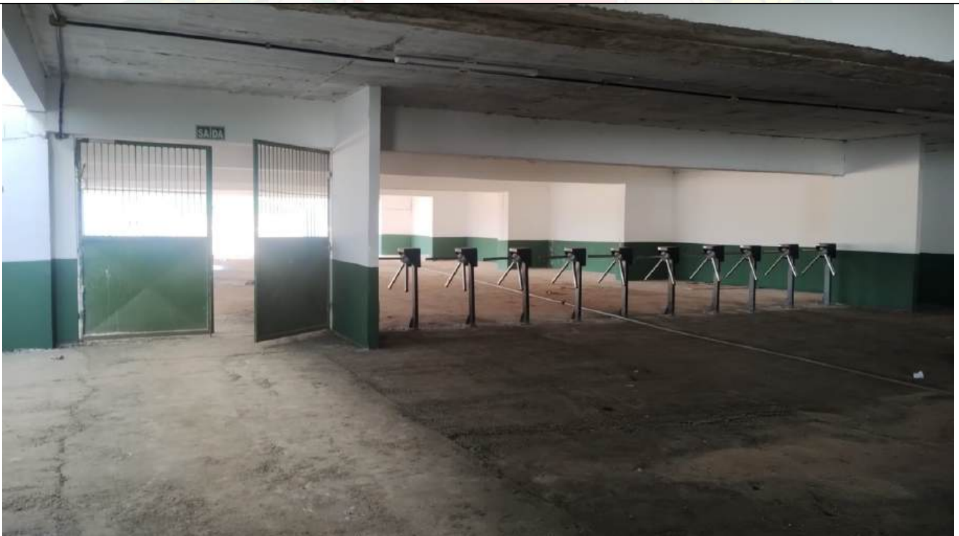
Arquivo 16 - SEM ILUMINAÇÃO E PORTÕES SÃO IRREGULAR.jpeg