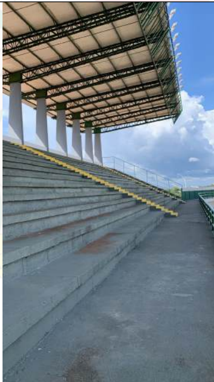
Arquivo 23 - VISTA DOS ASSENTOS.jpeg