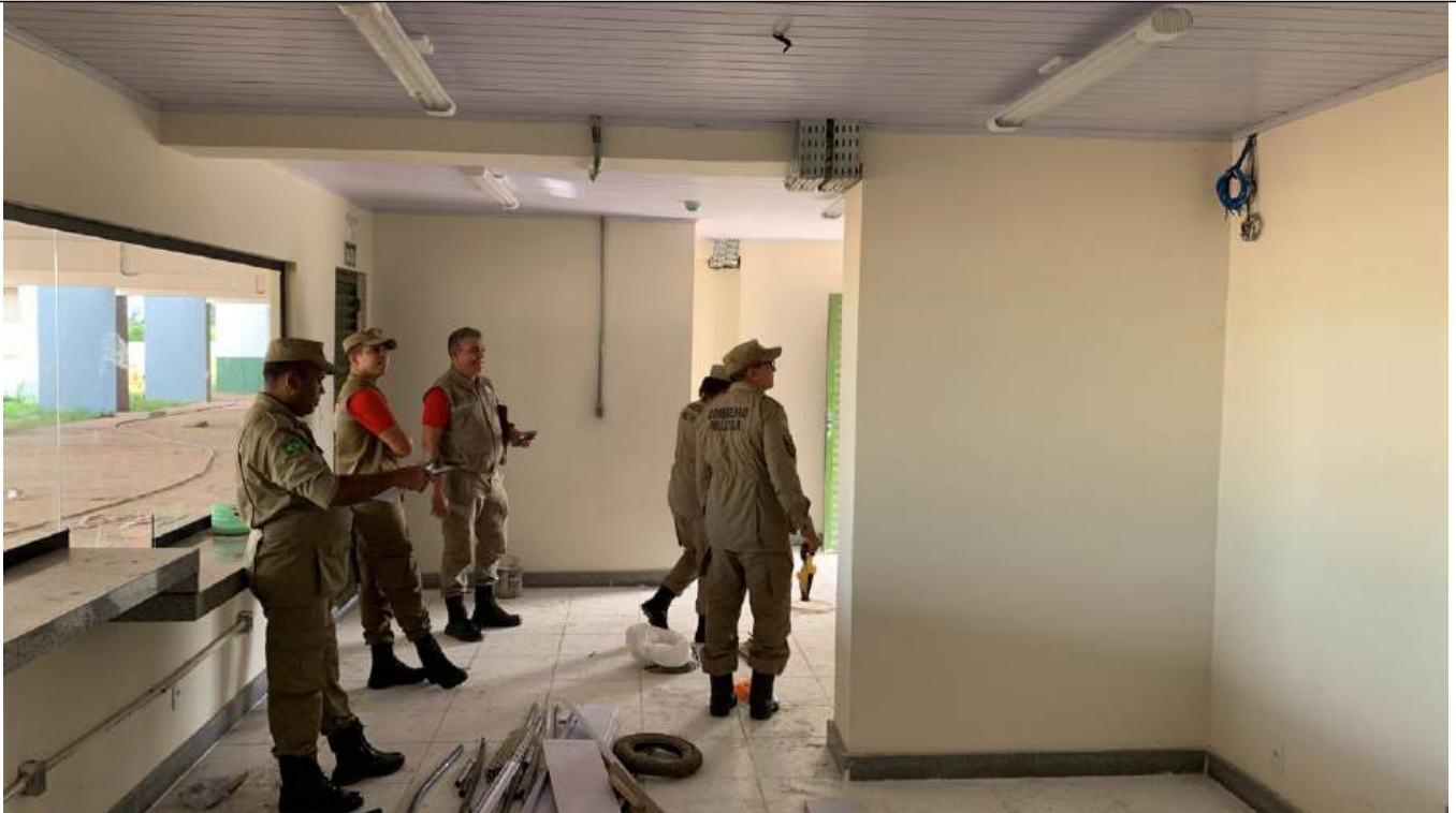
Arquivo 15 - SEM EQUIPAMENTOS E SEM SINALIZAÇÃO E ILUMINAÇÃO DE EMERGENCIA.jpeg Registro de Atribuição