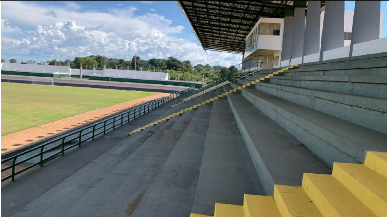
Arquivo 17 - SEM ASSENTOS E SEM IDENTIFICAÇÃO.jpeg