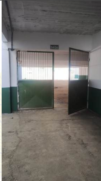
Arquivo 11 - PORTÕES SEM BARRAS ANTIPANICO.jpeg