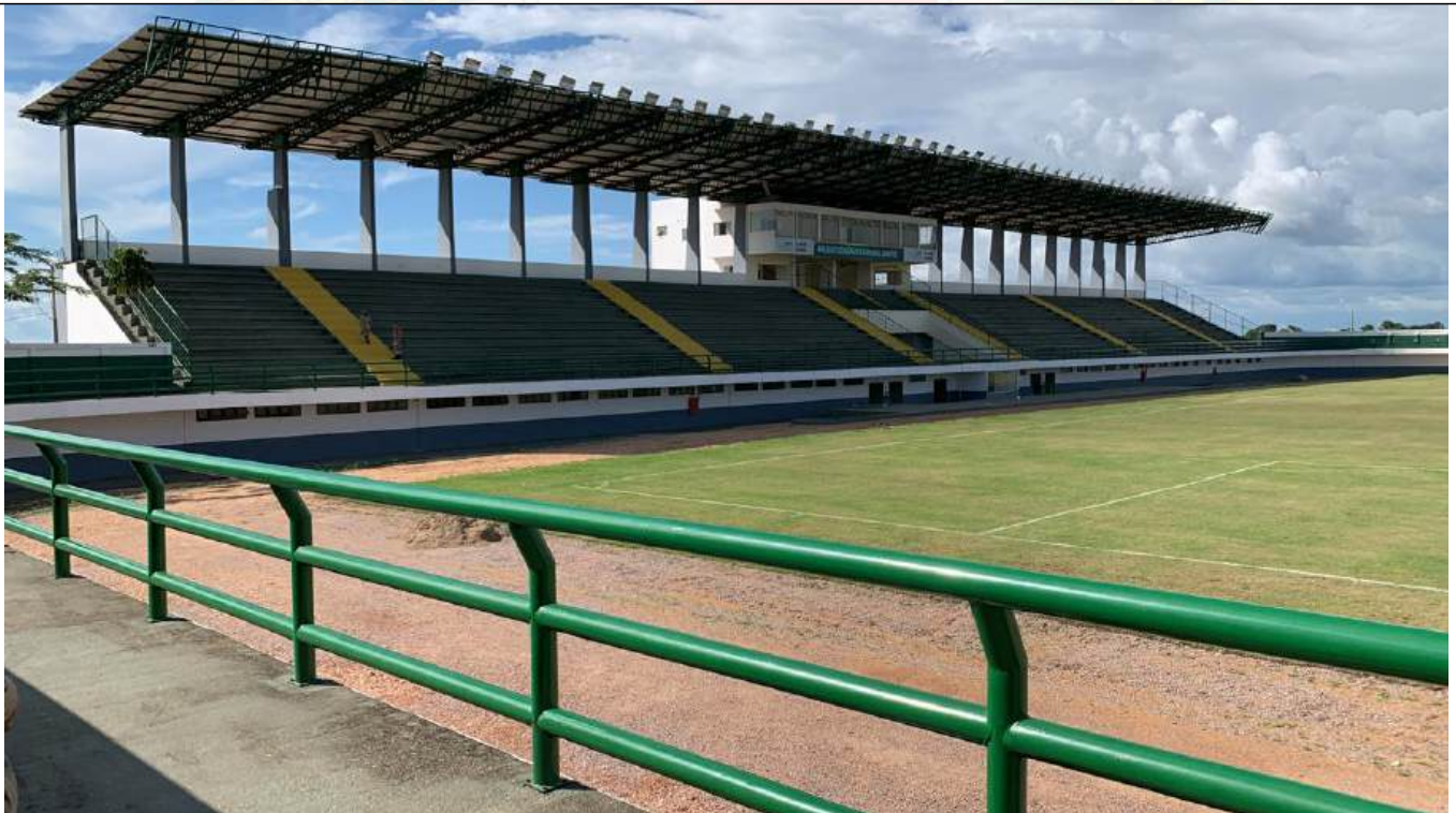
Arquivo 12 - PASSARELA QUE DÁ ACESSO ÀS ARQUIBANCADAS.jpeg