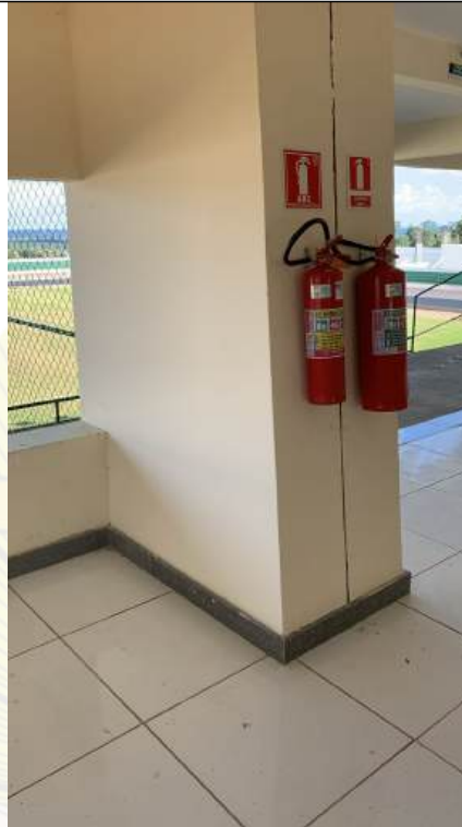
Arquivo 20 - SINALIZAÇÃO DE EQUIPAMENTO INCOMPLETA.jpeg