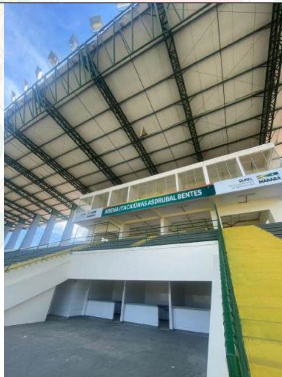
Arquivo 03 - FACHADA.jpeg