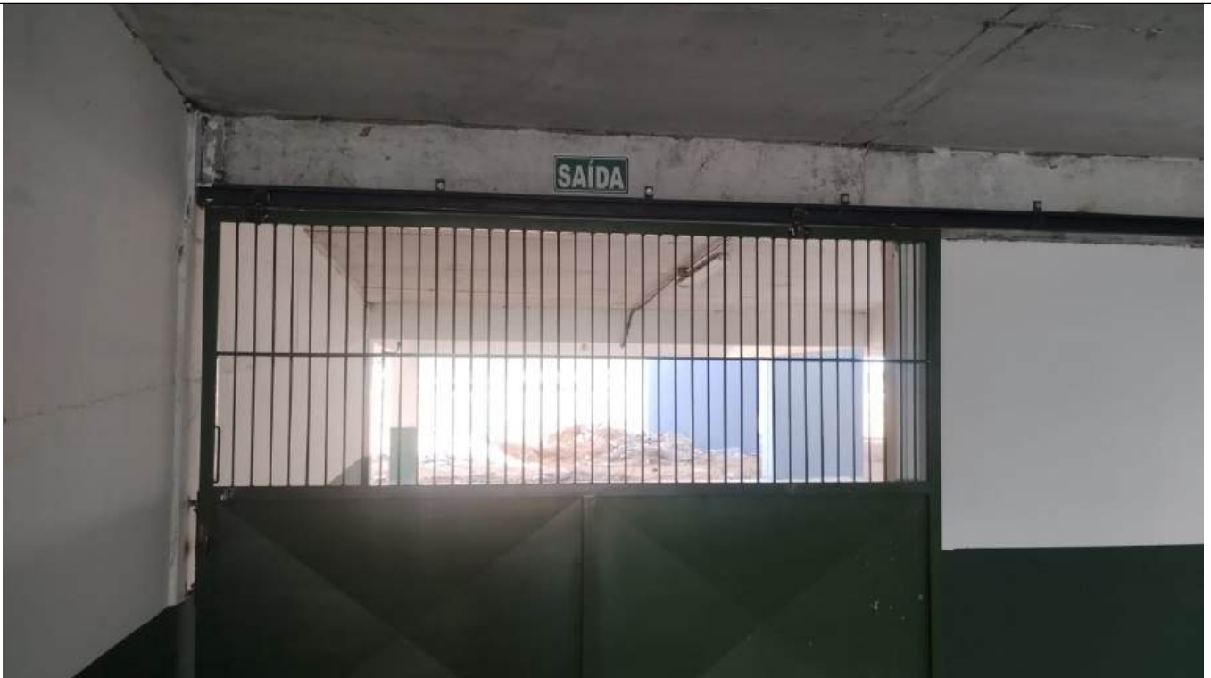
Arquivo 04 - ABETURA UTILIZANDO PORTÕES DE CORRER.jpeg