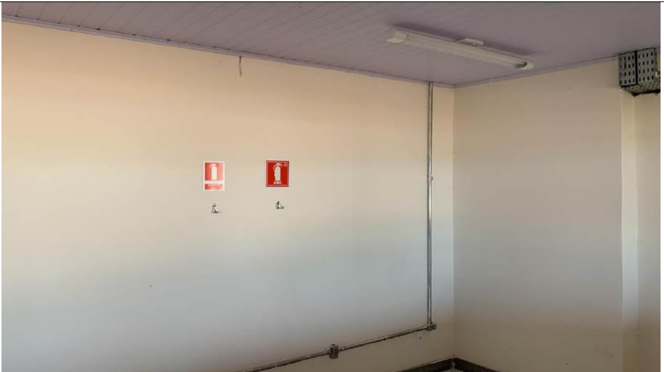
Arquivo 02 - AUSENCIA DE EQUIPAMENTOS .jpeg