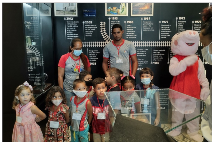
Visita para o público infantil é diferenciada.