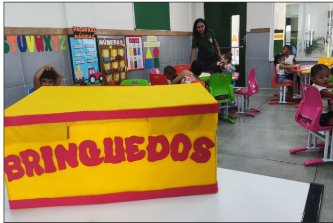
Local também conta com todos os móveis novos.