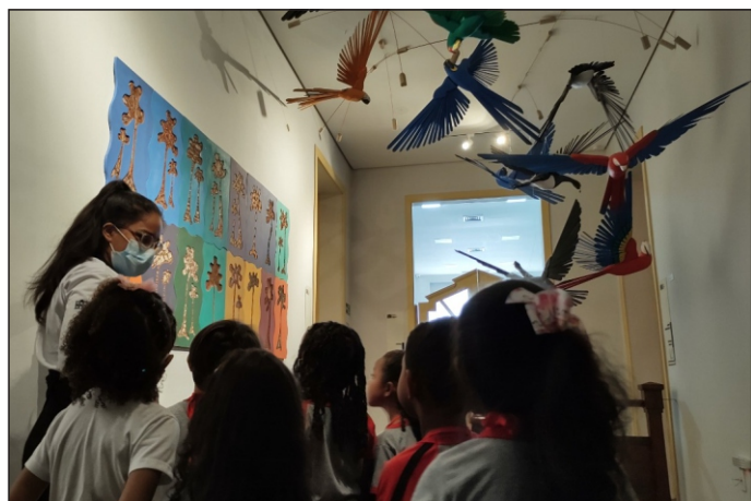
Crianças ficam deslumbradas com as apresentações do museu.

Desde sua inauguração, há um ano e oito meses, o museu já teve 13.516 visitantes, lembrando que boa parte desse período foi durante a pandemia, onde as visitas eram limitadas pelo isolamento social. Só em março deste ano foram 560 visitantes.