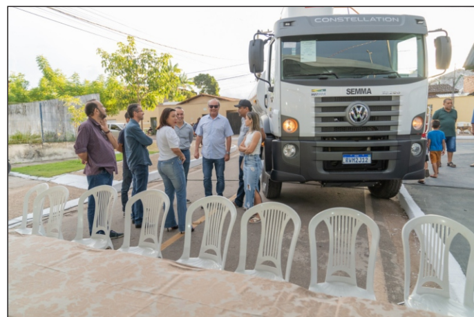
Cerimônia também contou com entrega de caminhão pipa a Semma.