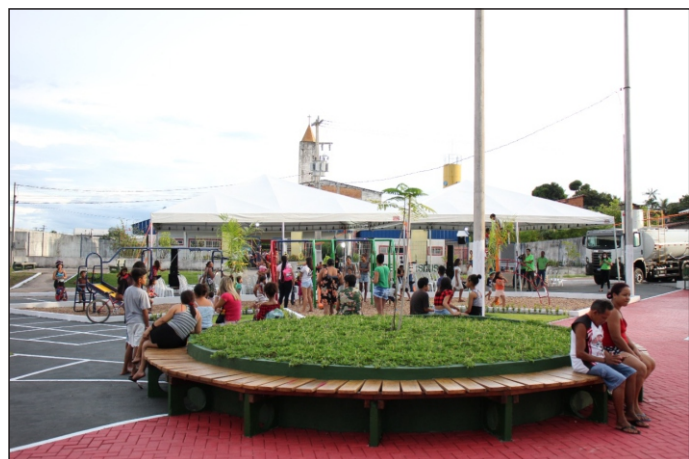
Obras atendem cerca de 40 mil habitantes do entorno.

Durante a cerimônia, a Prefeitura entregou um caminhão Pipa, com capacidade de 20 mil litros, para a Semma. Essa semana tem mais entrega para a comunidade. Na próxima quinta-feira (14), teremos a reinauguração da Escola Salomé Carvalho, na Folha 16.